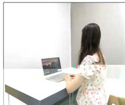
图3：侧后方第二机位效果图。