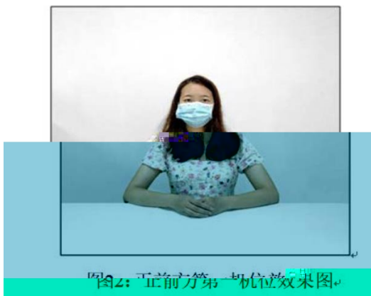
图2：正前方第一机位效果图。